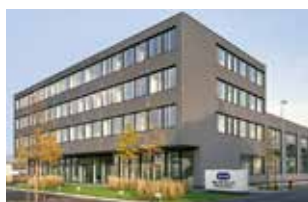
Headquarters of the WAB-GROUP

Junkermattstrasse 11 P.O. Box 944 4132 Muttenz 1 Switzerland Tel. +41 61 6867-100 Fax +41 61 6867-110 wab@wab-group.com www.wab-group.com